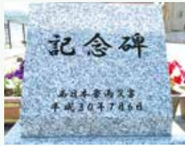
瀬野福祉センター前の記念碑

災害発生から数日後に地元ボランティアによる土砂撤去作業が行われていた瀬野駅東側踏切付近の当時(左側)と現在(右側)の様子