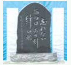
犠牲者の同級生が「忘れない あの日あの刻 絆の輪」と揮毫した記念碑