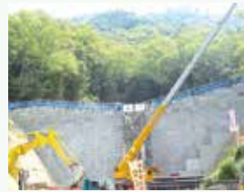
梅河ハイツの完成間近の砂防ダム