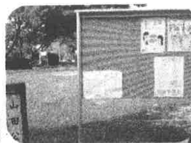
内・外両面に貼れる設計の やまたオリジナル掲示板