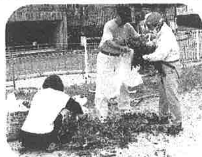
館長の福間先生も一緒に作業