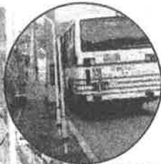
つながる Proj で設置された長椅子