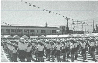
第70回運動会の準備体操

今後も目的の達成のため、活動してまいります。ご理解ご支援の程よろしくお願い申し上げます。