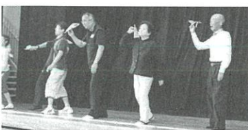
雨天のためグラウンドゴルフを紙飛行機飛ばし大会に変更し開催