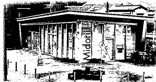
緑井駅前サロンのシンボルであった楓は、根張が増したため伐採し、テーブルとなりました。

また貸室業務(レンタルルーム)については、社協の地域活動に支障のない範囲で貸し出すもので、営利を伴う商用利用は1時間当たり税込み千円をお願いし、緑井駅前サロンを維持管理するために必要な光熱水費に充てるほか、将来の修繕へ積み立てます。一方で、佐東地区内のサークル活動や打合せなど非営利で利用される場合は、空調費用を除き原則無料とします。社協利用や有料申込を優先する対応にはなりますが、詳細は緑井駅前サロンに問い合わせの上、利用申し込みをお願いいたします。また、インターネットによるお申し込みも可能です。緑井学区社協のホームページ、レンタルルーム予約から、もしくは、下記QRコードからお申し込みください。