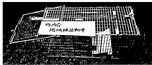
前夜仕掛け、捕獲機で捕えられた猫は、翌朝、動物管理センターに運び、不妊手術(無料)され翌日引き取りに行きます。

*広島市では、「地域猫活動」に取り組む町内会からの支援申請に基づき、動物管理センターでは無料手術を行います。 お問い合わせ、広島市動物管理センター中区富士見町11番27号 082-243-6058