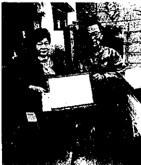
山根様(左)と中相田町内会長(右)