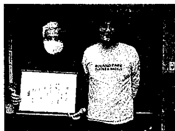
椎木様(左)と河原町内会長(右)