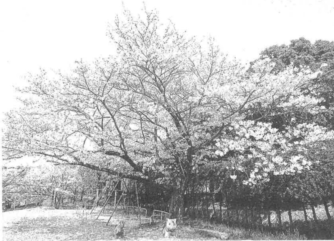
ゴリラ公園の大きい桜の木の満開です 4月8日撮影

春は、新しい出会いとともに一年で一番、心も体もウキウキする季節です。しかし、例年と異なる春を迎えています。新型コロナウイルス感染症に対して、全国規模で感染拡大を防ぐ対策が取られています。