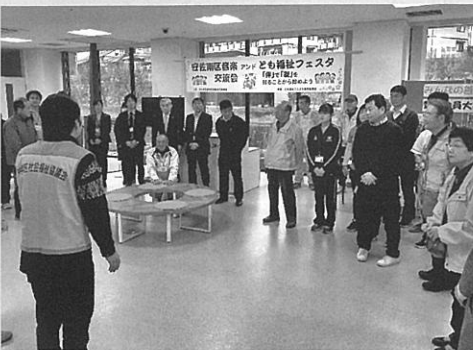
フェスタ会場に集うスタッフ(11月24日・交流スペース)

これは、さまざまな障害の特性や障がいのある方が困っている点、気配りの仕方を学びます。ちよつとした配慮を日常生活で実践することを通して、だれもが暮らしやすい地域社会を一緒につくります。