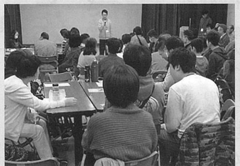
連携した音楽交流会(沼田公民館)