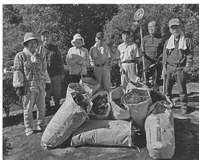
草取りの訪問作業に参加した会員 (昨年10月10日)