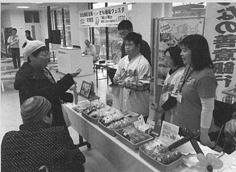
相互理解を図る出店コーナー