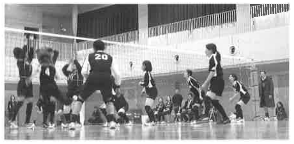
かもめ杯(令和2年2月11日) 吉島中学校区親善バレーボール大会。 オリンピックさながらの好プレー(?)続出。 優勝は三連覇を果たした吉島学区OB・OG チームでした。