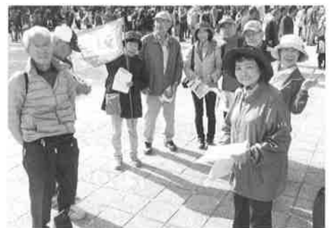
歩こう会(11月7日) 点呼のあと、錦秋の宮島の散策へ出発。