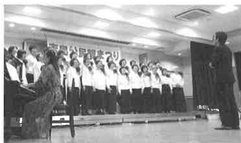
公民館まつり(11月9日) 女性三部合唱のコーラスグループ 「サングレース」の演奏に観客は聴き 入っていました。