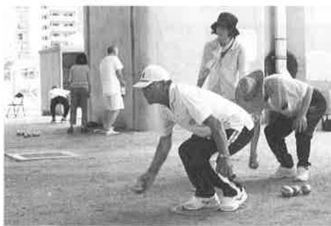
ペタンク大会(8月26日) 暑い中、高架下での熱戦