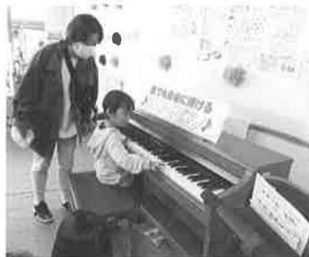
公民館まつり(11月9日) 公民館ピアノ(?)は大人気。 ソロあり、連弾あり。 みんな“ピアニスト”