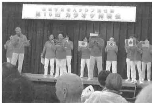
敬老会・カラオケ大会(9月11日) 町内ごとに、工夫を凝らした出し物で盛りあがる。