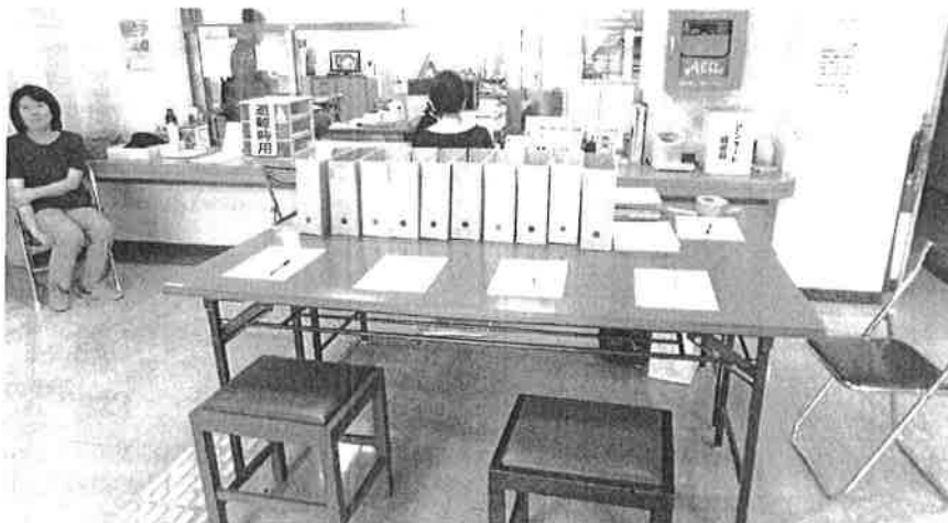
令和元年 8 月 15 日 5 時に発令した、警戒レベル 3 で開設された福祉的避難所

理由で一般避難所と福祉避難所と区別をするために福祉センターを「福祉的避難所」として、安芸区役所へ要望いたしました。 いろいろな課題をクリアされ福祉センターは「福祉的避難所」として開設をしていただくことになりました。