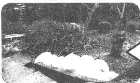
伐採し、きれいに集められた雑木と土のう袋の山(処理は安芸区役所)