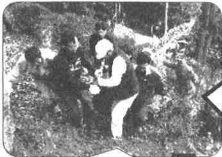
最後は人力で運び