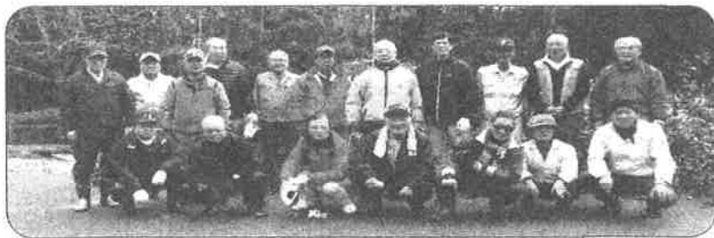
ある日の岩滝公園会のメンバー

連合町内会の方々が主だって活動されている岩滝公園会。この近年、岩滝公園がどんどんきれいになっているのは岩滝公園会の方々のおかげです！