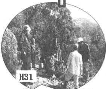
H31 初めてのしだれ桜