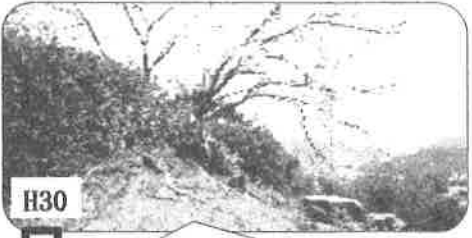
H30 安芸区役所にニセアカシアの 大木を伐採してもらいました