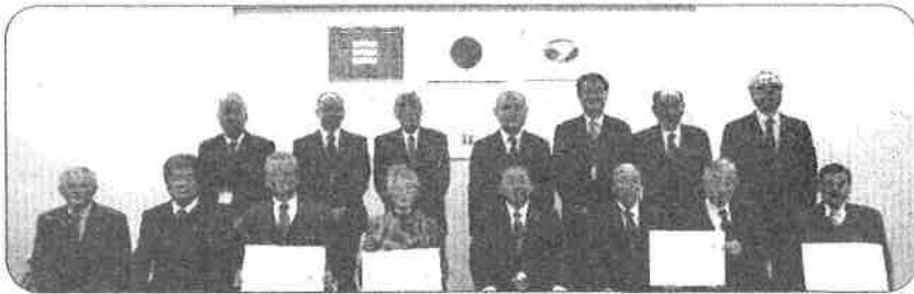
安芸区長表彰式 (安芸区役所にて)

連合町内会の方々が主だって活動されている岩滝公園会。この近年、岩滝公園がどんどんきれいになっているのは岩滝公園会の方々のおかげです！