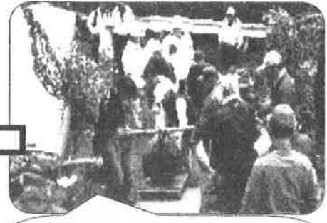
植樹する桜を台車に乗せて (丸い玉は根っこです 枝もまとめられています)