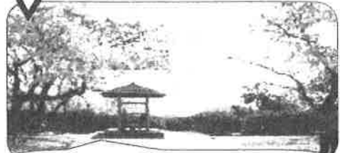
眺めがとても良くなりました!