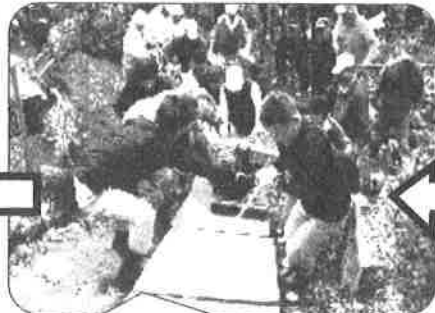
ベニヤ板の上に台車を乗せ 引っ張り上げ