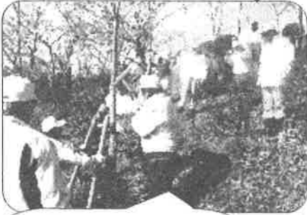
倒れないよう支柱を 立てて固定します