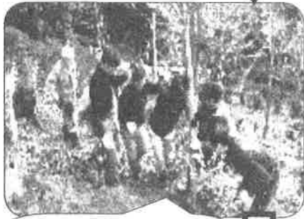
事前に穴を掘った 植樹場所へ植えます