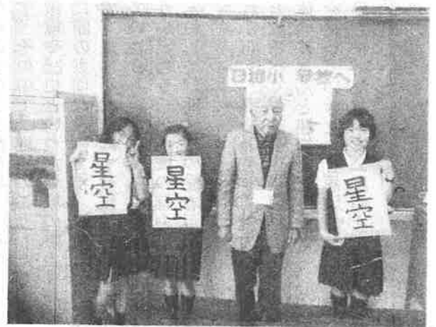
名人に学ぼう(4年生)書道