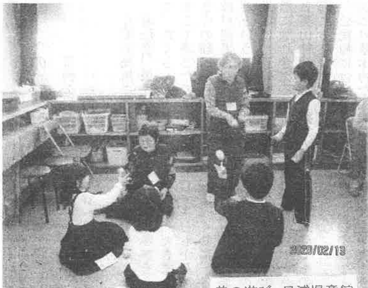
昔の遊び 日浦児童館