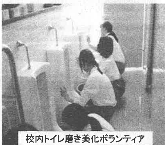
校内トイレ磨き美化ボランティア