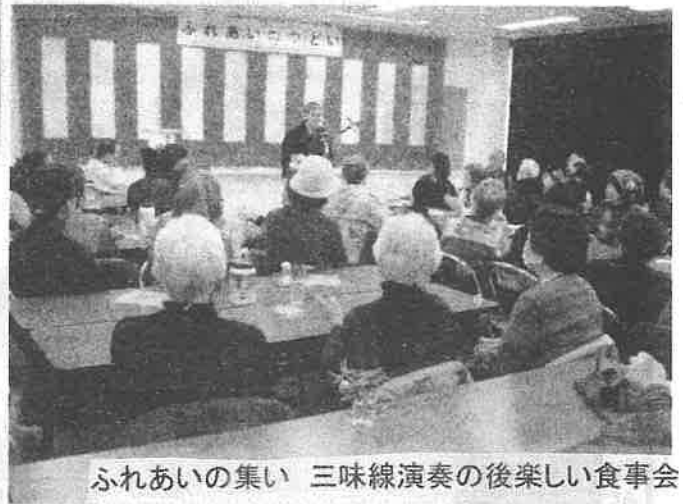
ふれあいの集い 三味線演奏の後楽しい食事会