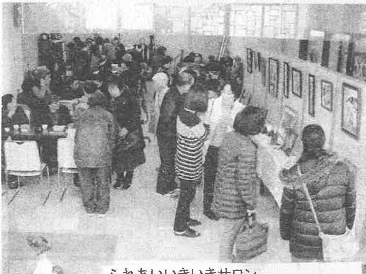
ふれあいいきいきサロン 地域の皆さんのいこいの場(会場はJA1F)