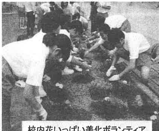
校内花いっぱい美化ボランティア