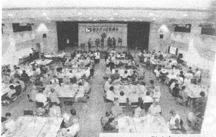
R1, 9, 18, 敬老祝賀会開催