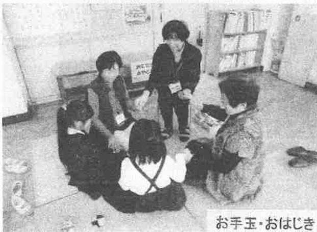
お手玉・おはじき