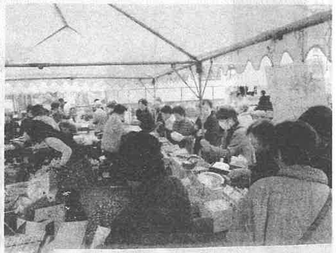
日浦公民館祭り R1, 11, 3, 福祉バザー出店