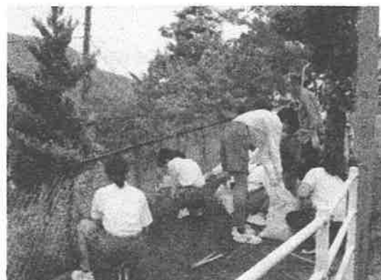
あさひが丘クリーンキャンペーンボランティア