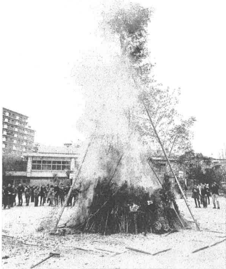
とんどの火が燃え上がる中、ぜんざい・甘酒・竹酒・餅が振る舞われました。焼き芋が焼きあがる間のピンゴ大会では多くの方の参加があり、ピンゴが出るまでの期待とリーチから抜け出せないため息で盛り上がりました。

まつりにご参加いただいた全ての皆様、そして校庭を提供して下さった鈴が峰小学校、ありがとうございました。