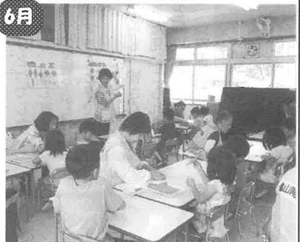
亀山南保育園平和学習