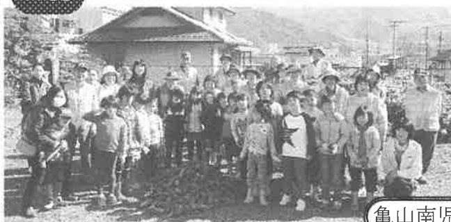
亀山南児童館 お芋ほり