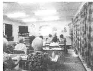
虹山4区いきいきサロン 訪問交流