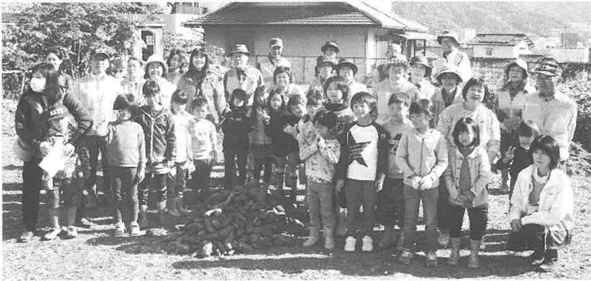
亀山南児童館をお招きして秋のお芋ほり