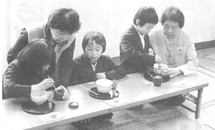
亀山南児童館お茶会