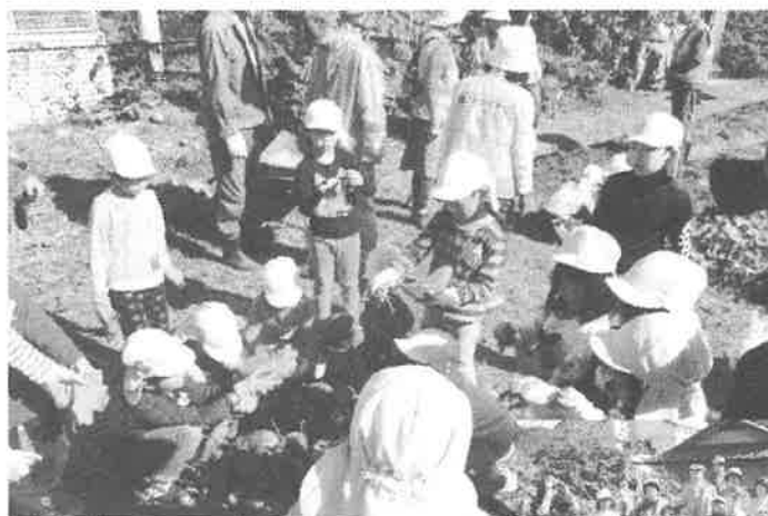
亀山南保育園お芋ほり