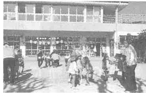
なないろこども園おもいもパーティー