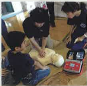
まず救急車を呼ぶ、心臓マッサージ、AEDで救う命