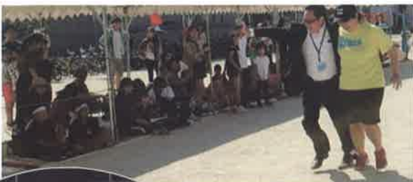
校長先生、がんばれ!