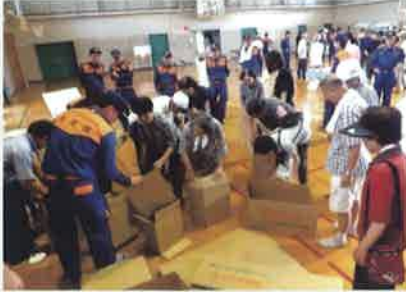
段ボール箱を組み立ててベッドを作ります

いつ何時起こるかわからない火災や自然災害。日頃の訓練が何よりも大切になります。「自助」「共助」「公助」の3つを柱に一人ひとりの防災意識を高めていただきたいと思います。