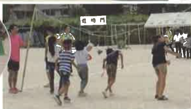
ふりまわされずに!