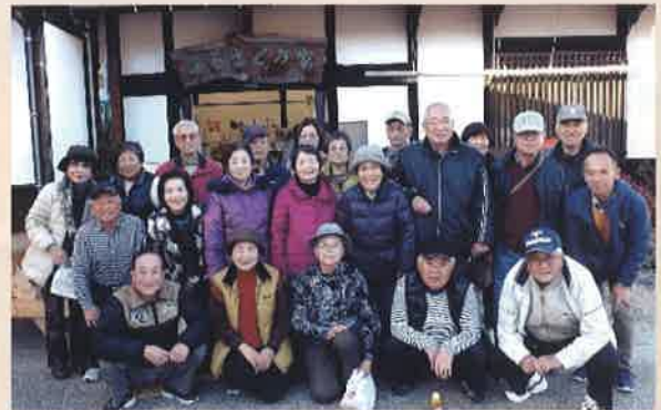
全員で記念撮影、笑顔が素敵ですね