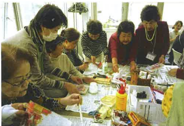
にぎやかに。真剣に。