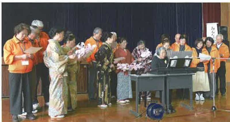
社協運営役員とボランティアの皆さん