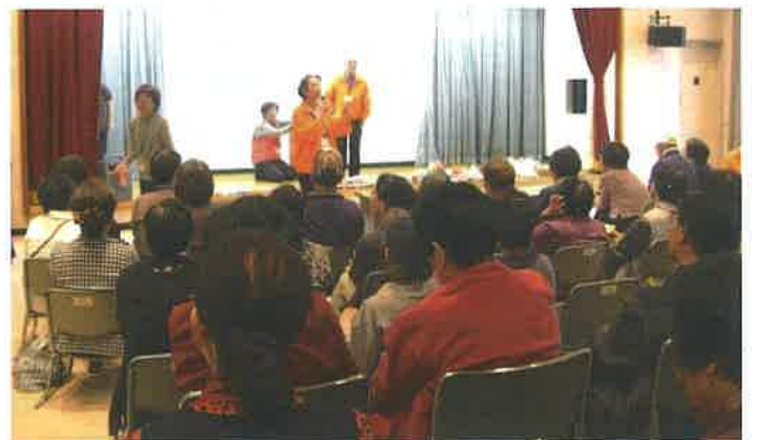
締めは空じなしの抽選会！