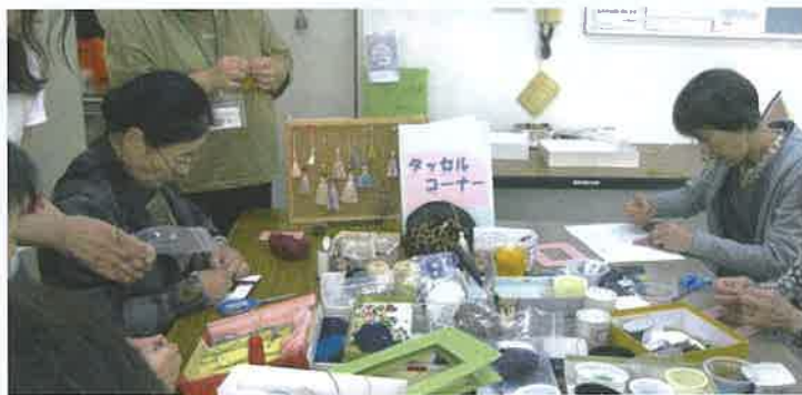
手芸コーナーでは作品作りに夢中！