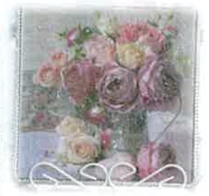
デコパージュ作りに 初挑戦！