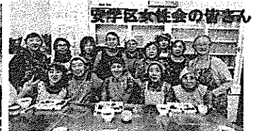
女性会・民生委員のみなさん、おいしいお弁当、御馳走様でした!