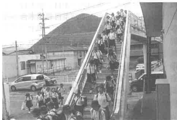
新しくなった亀山小学校前の陸橋

今年度、学校の教育目標を「あたたかい心とたくましい体を育み、確かな学力をつける」としました。また、子どもたちが目指す指標として、「亀山っ子プライド」を掲げました。これ