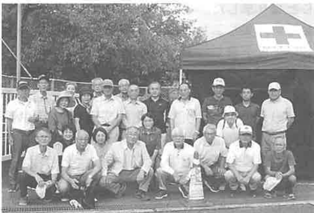
献血推進協力会スタッフ

亀山学区献血推進協力は9月28日(土) アルゾ可部店で実施しました。受付総数70名、採血者数57名。13名の方が比重不足などで採血できませんでした。採血合計は22,800mlです。ご協力有り難うございました。