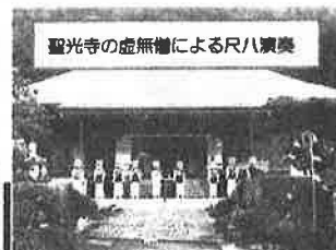
聖光寺の虚無僧による尺八演奏