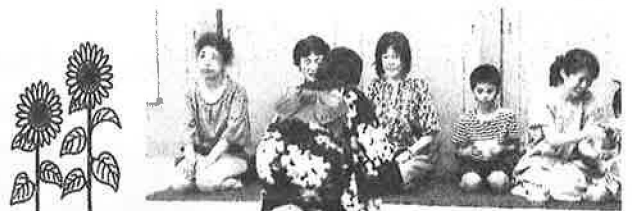
桜が丘高校茶道部による抹茶のおもてなし