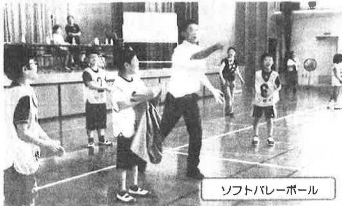
ソフトバレーボール

7月7日(日)、暑い七夕の日に子どもたちの熱い戦いが繰り広げられました。今回の競技は、低学年はドッジボール、高学年はソフトバレーボールと初めて2種目での開催となりました。