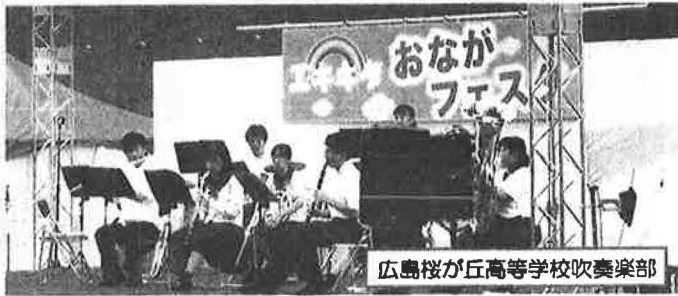
広島桜が丘高等学校吹奏楽部

7月27(土)・28日(日)、2日間にわたり、エキキターレにて行いました「エキキタおながフェスタ2019」には、延べ5300人もの方にご来場頂き、誠に有難うございました。