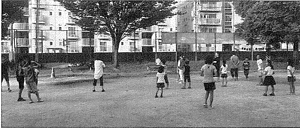
山本第八公園でのラジオ体操

すると息子の言っている通り、私の住んでいる地域には、本当にラジオ体操を行っている場所がなかったのです。子どもたちにとっては、生活リズムが崩れたりする（休み明けの不登校問題や、休み明け呆け、自殺問題など）ので、真つ先に地域の方々に声かけをし