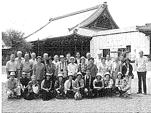
立専寺団体参拝 西本願寺 御影堂

地域の世話をさせて頂いたおかげで、地域の老若男女を問わず多くの人と接し、多くの人を知ることが出来、大きな財産となっております。