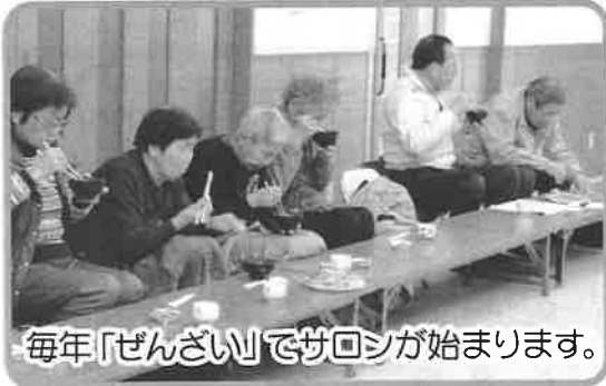
毎年「ぜんざい」でサロンが始まります。