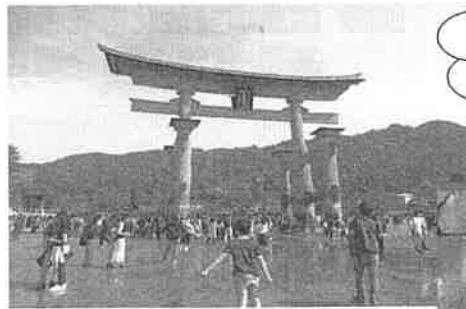
歴史を見続ける大鳥居