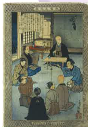
▲源氏物語を講義している保己一