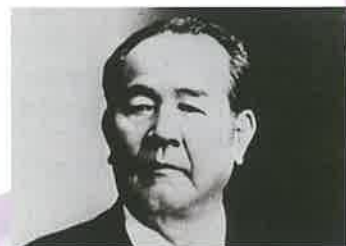
▲渋沢栄一