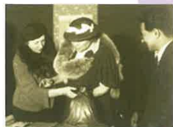
▲保己一の小さな像に親しげに触れているヘレン・ケラー

世界的偉人として讃えられる、目も見えず、耳も聞こえず、そのために話すことも困難であった女性、ヘレン・ケラーは、昭和12年(1937年)、埼玉会館で開かれた講演会でこのように話しています。