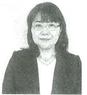
学校・保護者・地域が一つのチーム

平成は自然の驚異を見つめ直す日々でした。令和を迎え、新たな出会いと気持ちをもって、様々な行事に取り組んで行けたらと思います。