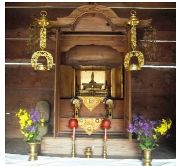
本堂にある御本尊様

子供たちの遊び場だったり、ラジオ体操をしたり、近所の人達が集まる場所として使われていました。平成になって正地集落の方たちが、粗末にならない様にと毎年4月の第1日曜日に、現在のような「観音さんまつり」を始められたそうです。