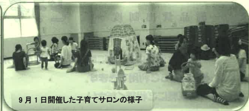
9月1日開催した子育てサロンの様子