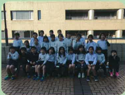
中区子ども会冬季大会