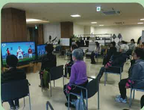
ほほえみ体操クラブ 西平塚エクセレント 木曜日 10:00~