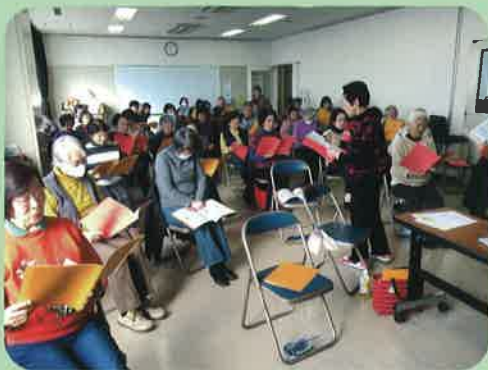
スマイル体操 竹屋公民館 木曜日 10:00~