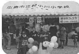
かこがわ子どもフェス