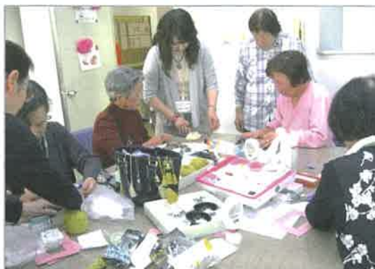
「ここはこうするんですよ」 先生の手元を真剣に見つめる