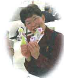
「私の作品、可愛いでしょ！」