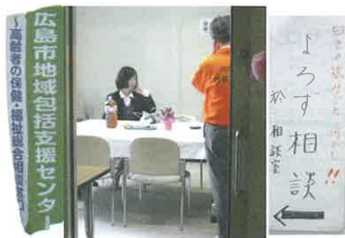
「三人に行くのが大変なので、こちらに来てもらって助かりました」。相談に来られた人のことば