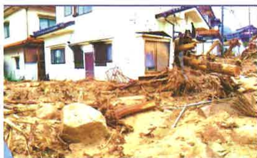
＝口田南5丁目付近の土砂崩れ現場＝ 巨大な岩を巻き込んだ大規模の土砂堆積はこれまでの風景を一変させた