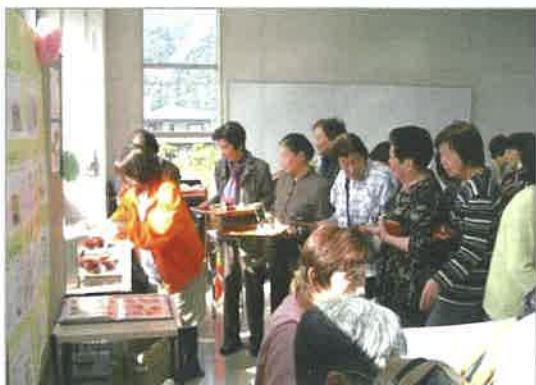
お昼どき、おむすびとお汁を求めて長い列が