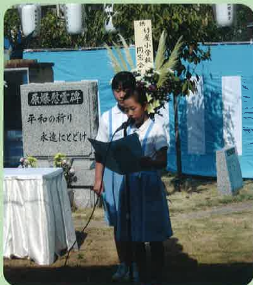
竹屋地区原爆死没者慰霊式典