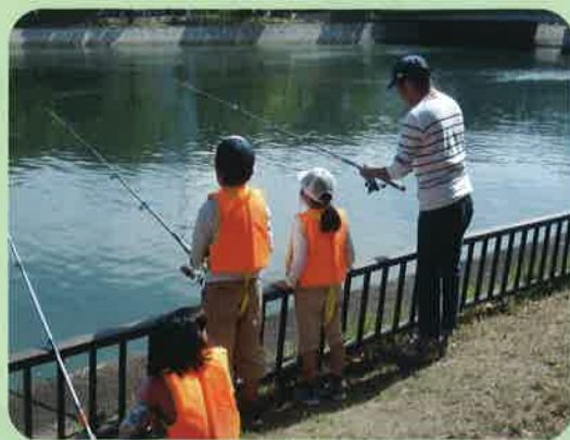
世代交流 はぜ釣り大会