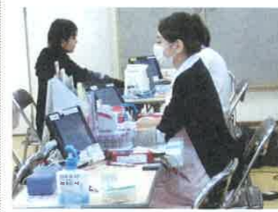
献血受付→問診票回答→問診及び 血圧測定→血液比重測定→献血

献血活動への協力 11月7日(水) 古田公民館 9時から12時 主に古田学区公衆衛生協議会、古江女性会が、毎年掲示板や回覧板などで町内の皆さんにあらかじめお知らせしています。 当日も女性会のメンバーが、プラカードや会場の案内、献血に協力していただいた方に地域として粗品を渡していました。 今年は、三十数人の方が足を運ばれましたが、献血できた方は17名でした。