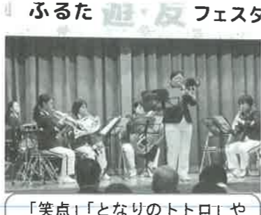
「笑点」「となりのトトロ」や演歌など親しみのあるお馴染みの曲でした

古江女性会は、広島県豪雨災害義援金バザーを担当しました。バザーの収益は、五万八千八百三十七円で県共同募金会へ全額寄付いたしました。皆様のご協力ありがとうございました。