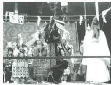
「所望分け」の一場面 演じる子ども達

10月21日(日)子ども神輿7日(日)の予定でしたが台風の影響でこの日に変更。田方集会所に集合後、11時過ぎに草津八幡宮でお祓いを受けた二基は、田方町内にくりだしました。