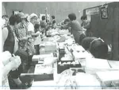
賑わう義援金バザーコーナー

古江女性会は、広島県豪雨災害義援金バザーを担当しました。バザーの収益は、五万八千八百三十七円で県共同募金会へ全額寄付いたしました。皆様のご協力ありがとうございました。