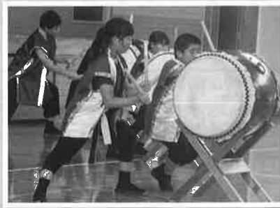
7月14日 児童館祭り(千田小学校)