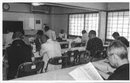
6月2日 公衆衛生推進協議会総会