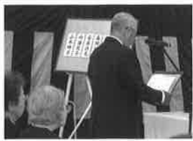
8月3日 被爆者慰霊祭