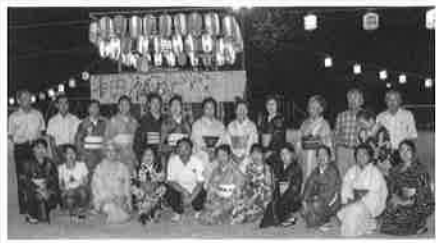
8月9日 子ども会 盆踊り