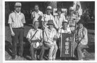
8月1日 平和公園一斉清掃