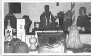
8月24日 平野町日切地蔵尊