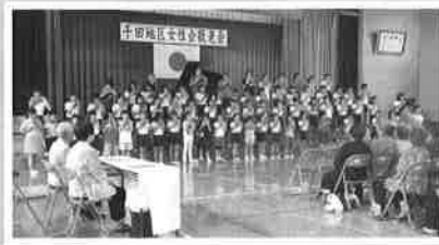
9月11日 地区敬老会(女性会)