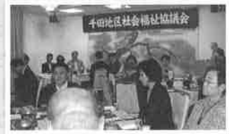
5月18日 社協総会(久里川)