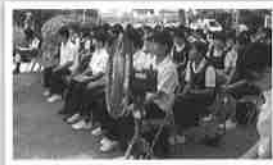
8月9日 小学校慰霊祭