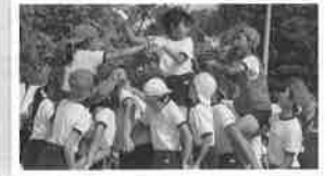
10月1日 運動会(千田小学校)