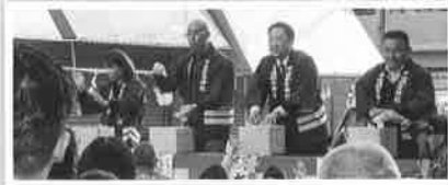
4月15日 千田胡神社大祭(年男)