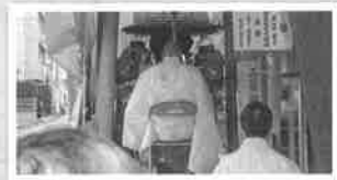
5月13日 南竹屋稻荷神社