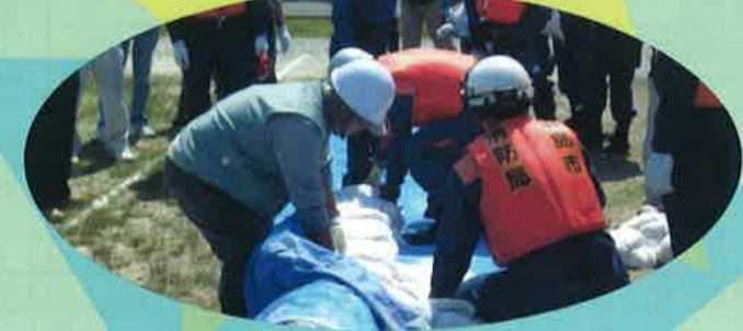
6月3日 中区水防訓練