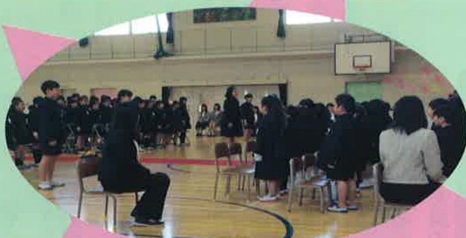
4月10日 竹屋小学校 入学式 49名