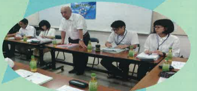
6月22日 第1回竹屋げんきネット運営委員会