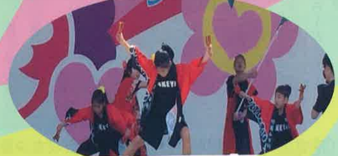
5月5日 フラワーフェスティバル 竹屋南中ソーラン (カーネーションステージ)