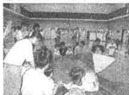
井口台民生委員児童委員協議会 大野