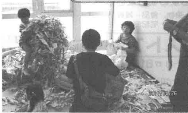
いきいき子育て応援フェスタin亀山