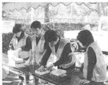
お一人暮らし高齢者様受付

ペットボトルなどのキャップに、ホウ酸団子のもとをみんなで詰めていきます。ひとり三〇個ずつ、最後にお菓子などの空き箱に入れてお持ち帰り! アイデアと行き届いた準備に、女性ならではの細やかな心配りを感じました。 九月から広島市のポイント事業が始まり、皆さんポイント手帳を持参しています。ポイントが活動の励みになっている感想を持ちました。ポイント手帳を入れる袋も、いきいきサロンで手作りしたもので、それぞれとても素敵でした。 「いきいきサロン上島」の皆さんの活動は、他のサロンの参考にさせていたただくとともに、今後の活動がますます活気に満ちたものになりましよう願っています。 (吉野 登喜子)