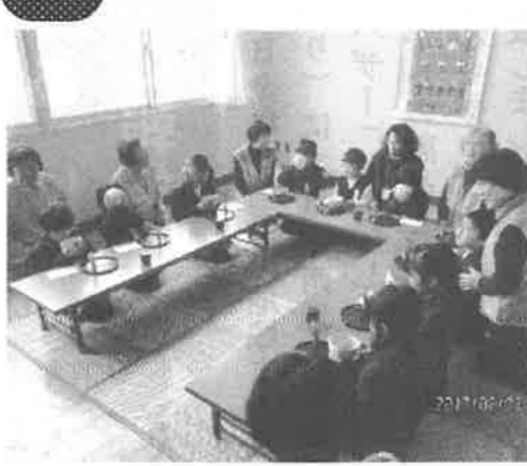
亀山南児童館お茶