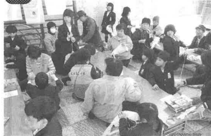
亀山南小学校むかし遊び