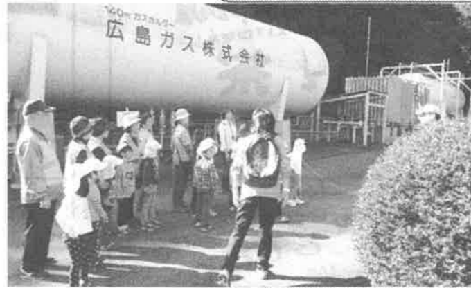
亀山南保育園児と感謝訪問。そのあとお芋ほり