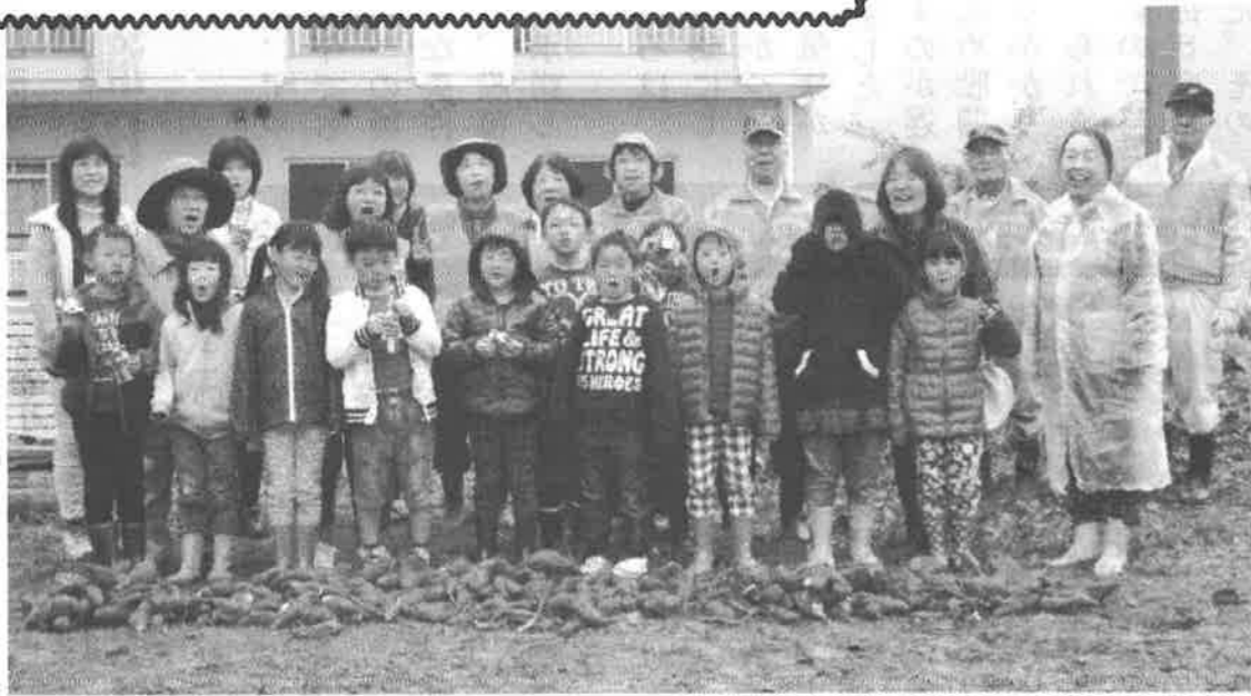
亀山南児童館の子供たちとお芋ほり