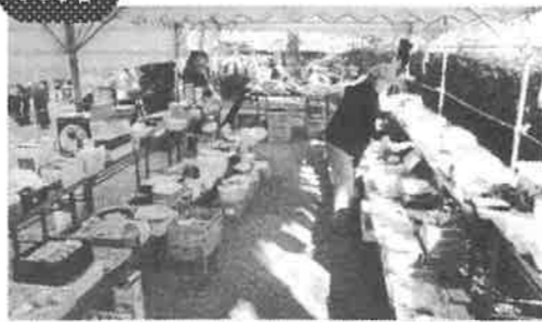
ふれあいバザー、公民館まつりには一人暮らし高齢者の方をご招待