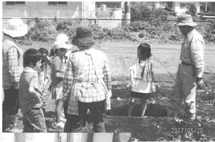
畑づくり、亀山南児童館を招いて、いもの苗つけ