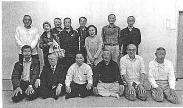
新年度役員の皆さん

新年度の主要事業「口田盆踊りの夕べ」は8月4日(土)、「自主防災訓練」は11月11日(日)の開催を予定しています。なかでも平成22年から毎年実施されている自主防災訓練は、多くの犠牲者を出した4年前の広島土砂災害を教訓に、防災意識をさらに強化して「共助の精神を養おう」と取り組まれています。