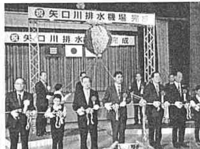
完成式式典会場であったテープカット

式典後、現地見学会も行われ、真新しい巨大ポンプや最新式の制御装置、自家発電設備など見る人たちは目を見張っておられました。