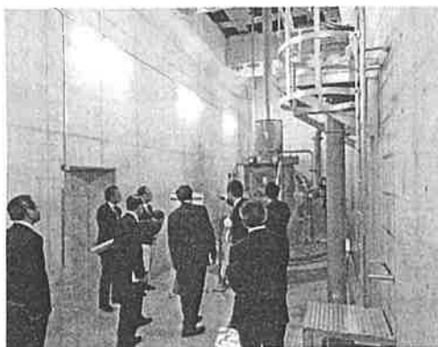
巨大なポンプを見学する参加者

大型水槽3基に加え、巨大なポンプ2基を増設し、既存ポンプと合わせた6基のポンプで1時間にプール(25t)115杯分を太田川に排水できます。安心して暮らせる街づくりが着実に進んでいます。実感できました。