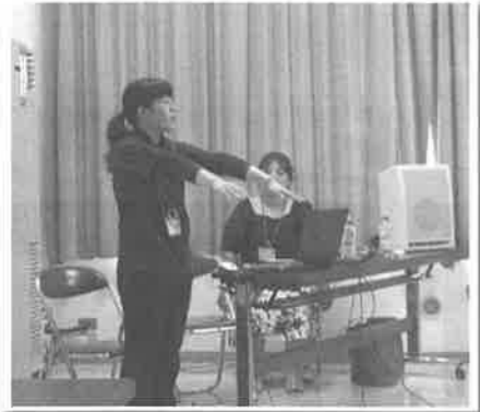
△7月：「健康体操(いきいき百歳体操)と いきいき活動ポイント制度の学習会」