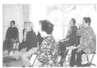
舌をさまざまに動かす、かみかみ百歳体操。誤嚥性肺炎を防ぐ効果があります。