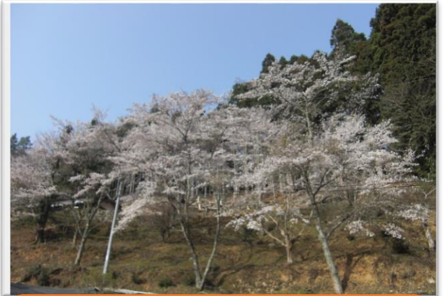
屋谷の桜は個人で植えられているのですが、たくさんあるので満開の頃はみごとです。