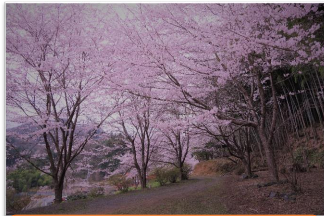
中の村の桜は県道沿いですが、橋谷側から見ると全体がよく見えます。