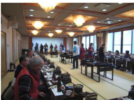
カラオケやビンゴゲームを楽しみました