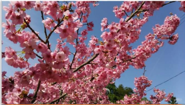
平藪神社の桜はピンク色が濃くて、とてもきれいです。