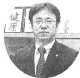
地域の誇れる学校に