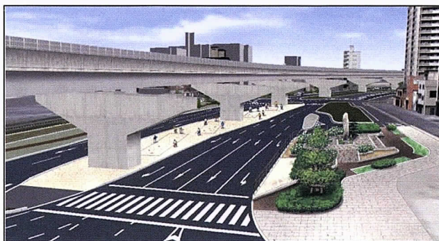
【御幸松の石碑保存広場完成イメージ図】

○計画の概要：①御幸松の石碑保存広場（430㎡）、②宇品西ペタンク場（1,220㎡）、③宇品東ペタンク場（730㎡）