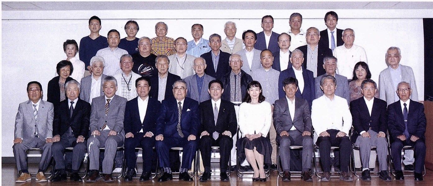
(写真) 理事総会を終え、記念写真を撮影する岸田文雄外務大臣(前列左から6人目)と胡麻田泰江南区長(前列左から7人目)、中原好治県議会議員(前列左から4人目)をはじめとする来賓と各町内会長の皆様