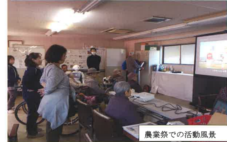
農業祭での活動風景

また、認知症の理解を深める為の「認知症サポーター要請講座」も随時開催しています。お気軽にお問合わせ下さい。 白木地域包括支援センター 白木町井原一二四番地 電話 八二八の三三六一 問い合わせ先