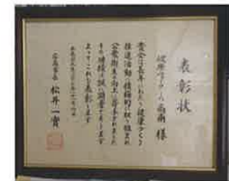
市長よりいただいた表彰状

一人暮らし高齢者の集い 十二月一日二十九名のひとり暮らし高齢者の皆さんと民生・児童委員、ボランティアの皆さん、高南保育園の園児、交通安全高南支部、白木包括支援センター 社協役員を加え五十六名で賑やかな集いとなりました。 高齢者の皆さんを対象に「いきいき百歳体操」のアンケート実施結果、ほとんどの人が体操をしている。体操をした結果なんとなく元気になったようだと答えた。今後いろいろな場を通じて体操の普及に努めます。