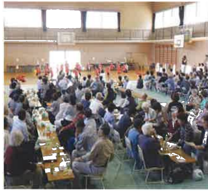
園児の演技を楽しくみる参加者

地域の皆様の力強いご協力が何よりも頼みです。今後ともご協力よろしく お願いいたします。