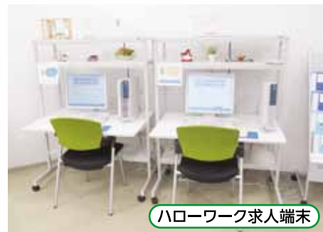
ハローワーク求人端末