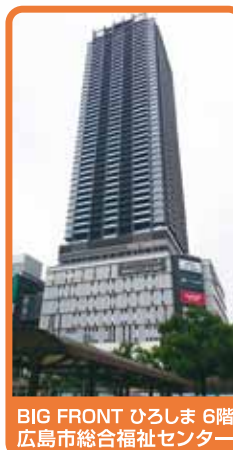
BIG FRONT ひろしま 6階 広島市総合福祉センター