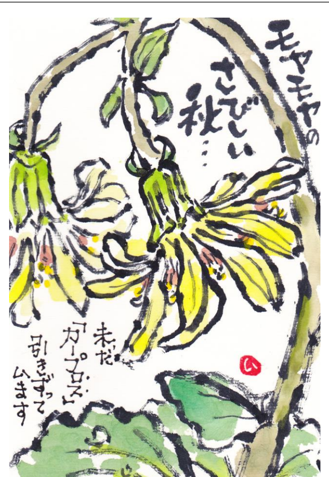
作尾 上育 子さん

参加費 お一人様100円 会場 力田病院1階ロビー 082-277-2101(田中)