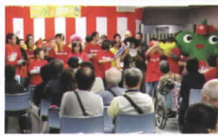
▲ 昨年のステージ発表の一場面。作業所の発表に会場も大賑わい。