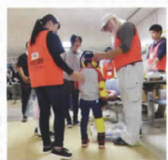
▲ 福祉体験に参加してボランティア活動に触れてみませんか?(写真は高齢者疑似体験)