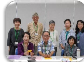
たのしい「おりがみ」の会のメンバー