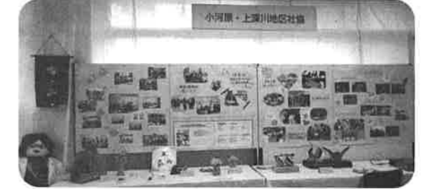
高陽公民館まつり