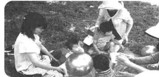
子育て支援「かこがわっこ」