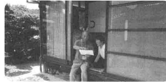
一人暮らしの高齢者訪問