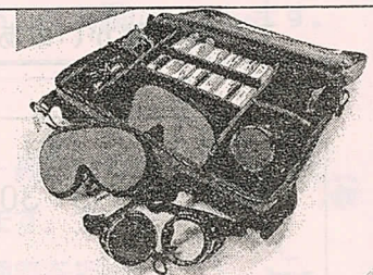
視覚障害者疑似体験セット