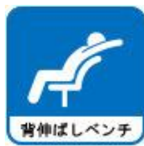
鈴が峰地区公衆衛生推進協議会