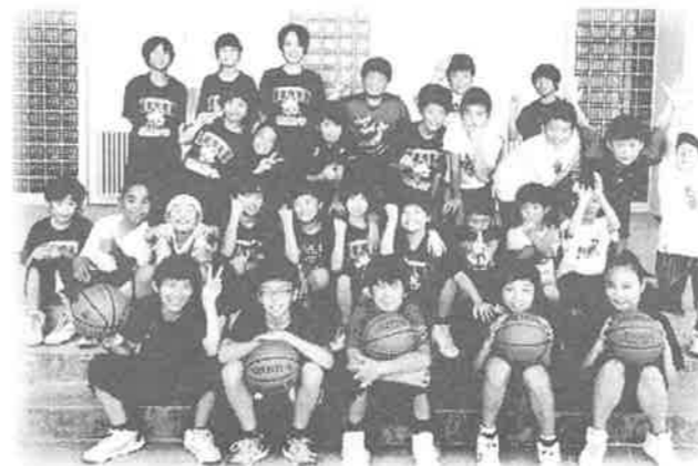
ミニバスケットボール 代表・別府 (256-7270) 月・水・木・土：大河小体育館