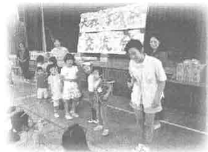
ようこそ 子ども会へ

今年、子ども会へ加入した15名の子どもたちが紹介された後、南区子ども会連合会「いちばん星☆」のお兄さん、お姉さんたちのゲームや、大河学区子ども会リーダーたちによる動物ビンゴゲームで楽しい時間を過ごしました。