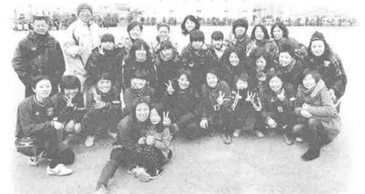
女子サッカー 代表・三樹 (253-0771) 水・土：大河小グランド